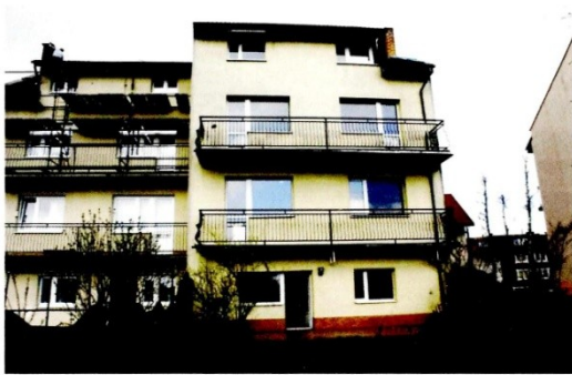
Widok budynku od strony ogrodu

I ustny przetarg nieograniczony na zbycie prawa własności nieruchomości zabudowanej, oznaczonej w ewidencji gruntów jako działka nr 1752 o pow. 0,0250 ha, położonej przy ul. Różanej 17 w obrębie miasta Ustka stanowiącej własność Powiatu Słupskiego, dla której Sąd Rejonowy w Słupsku VII Wydział Ksiąg Wieczystych prowadzi księgę wieczystą nr SL1S/00028433/5.