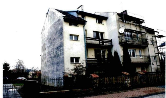
Widok budynku od strony ulicy Różanej